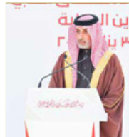
حلبة البحرين الدولية

أكد الرئيس التنفيذي لحلبة البحرين الدولية الشيخ سلمان بن عيسى آل خليفة أن امتياز عامل البلاد جفيرة صاحب البلاطة الملك حمد بن عيسى آل خليفة المفدى حفظه الله ورياءه وتكريمه ولي العهد رئيس مجلس الوزراء صاحب السمو الملكي الأمير سلمان بن حمد آل خليفة حفظه الله الجهود الوطنية المخصصة لكافة العاملين في صفوف الأمانة التصدي لفيروس كورونا من الكوادر الصحية وقوة دفاع البحرين، ووزارة الداخلية، وكافة الجهات المساندة يمثل دافعاً لمواصلة العمل بذات العزم والتصدي للجائحة، مشيداً بجهود موظفي حلبة البحرين الدولية المشاركين في التصدي لفيروس كورونا وأوراهم المشرفة في كافة مسارات التعامل مع الفيروس بما يحفظ صحة وسلامة الجميع. جاء ذلك لدى تفضل الشيخ سلمان بن عيسى بحضور رئيس إدارة حلبة البحرين الدولية والإدارة التنفيذية عارف رحيمي بتسلم 'وسام الأمير سلمان بن حمد للاستحقاق الطبي' للكوادر الوطنية من منتسبي حلبة البحرين الدولية، تنفيذاً لأمر الملكي السامي في إطار توجيه صاحب السمو الملكي ولي العهد رئيس مجلس الوزراء كافة الجهات المعنية بتسلم الوسام للعاملين في صفوف الأمانة من الكوادر الصحية وقوة دفاع البحرين، ووزارة الداخلية، وكافة الجهات المساندة، حيث أعرب تهنئته لكافة האחاضين على 'وسام الأمير سلمان بن حمد للاستحقاق الطبي' مشيداً بدور منتسبي حلبة البحرين ممن ساهموا في التصدي للجائحة فيروس كورونا.